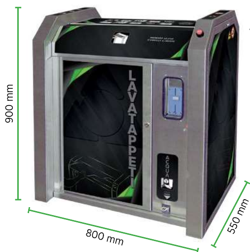
MOD. LT 400 MOD. LT 230