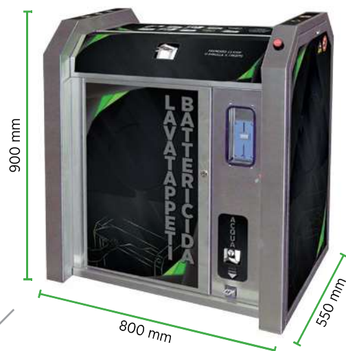
MOD. LT 400-B MOD. LT 230-B