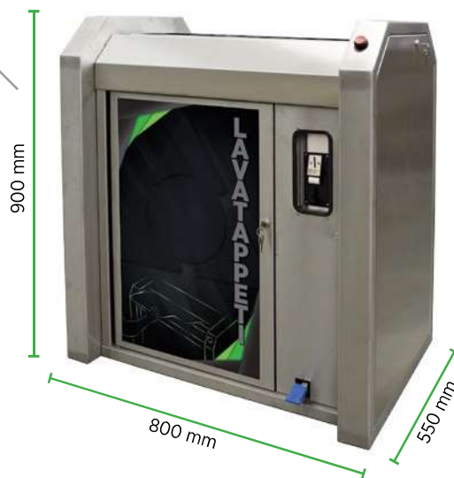
MOD. LT 400-ECO MOD. LT 230-ECO